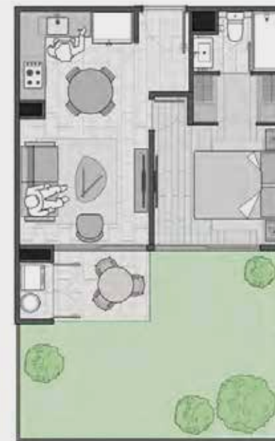
Modelo A1 1D-1B más patio

Materialidades de alto estándar y rendimiento: ventanas termopanel, piso fotolaminado y gres porcelánico, cubiertas granito, muros de cerámico y pintura, ascensor, entre otros.