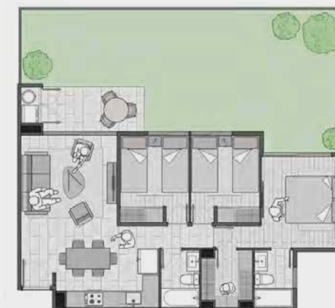
Modelo C1 / 3D-2B más patio

Departamentos de 41 a 78m 2 , 1, 2 y 3 dormitorios, con patio o terraza y opciones de distribución para elegir.