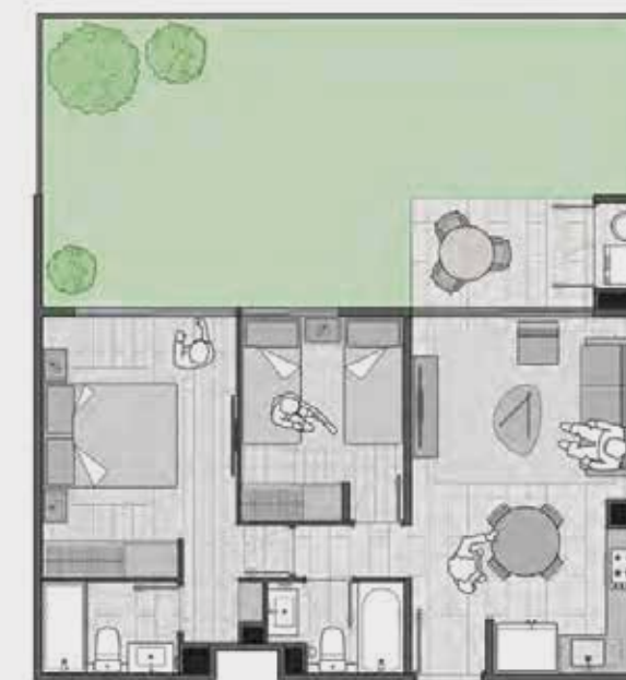
Modelo B1 / 2D-2B más patio